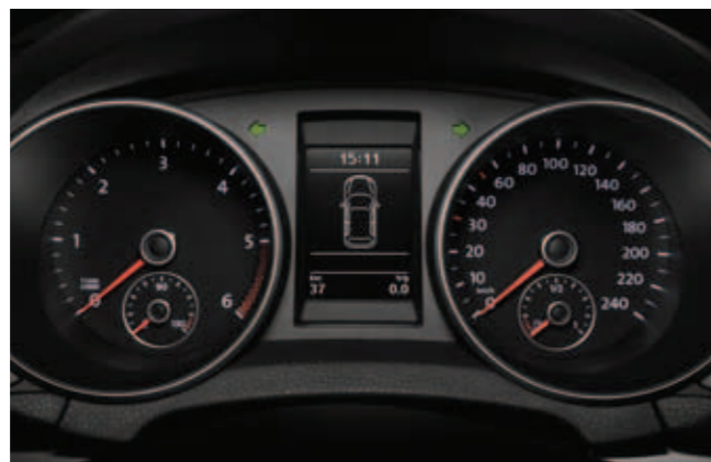
Białe podświetlenie zegarów i wyświetlacza komputera pokładowego.