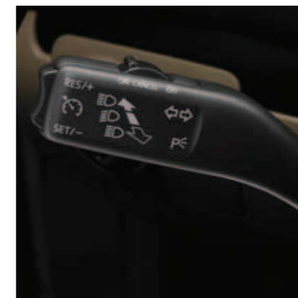
Tempomat (standard dla wersji Comfortline i Highline).