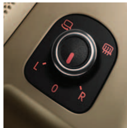
Gałka umieszczona w drzwiach kierowcy umożliwia sterowanie elektrycznie podgrzewanymi i składanymi lusterkami bocznymi (opcja).