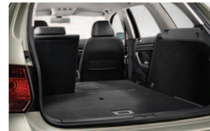
Funkcyjny bagażnik oferuje do 1495 l przestrzeni bagażowej.