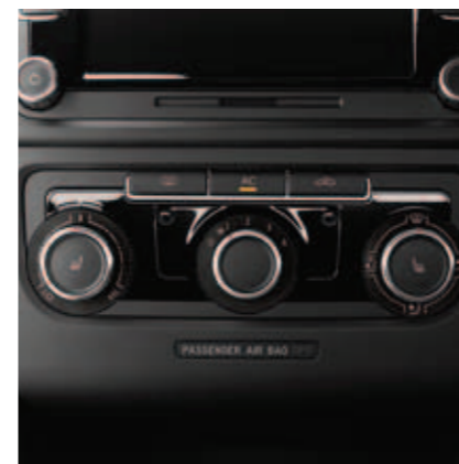
W wyposażeniu standardowym klimatyzacja manualna „Climatic” utrzymująca wybraną temperaturę we wnętrzu samochodu.