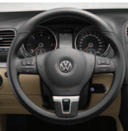
Multifunkcyjna, trójramienna kierownica obszyta skórą (standard dla wersji Highline).

Dzięki trzem wersjom wyposażenia Variant sprosta oczekiwaniom najbardziej wymagających użytkowników. W bogatej ofercie znajdują się m.in. systemy wspomagające kierowcę np. asystent parkowania „Park Assist” z kamerą cofania, oraz elementy zapewniające komfort wszystkim podróżującym: automatyczna klimatyzacja „Climatronic”, rozsuwany, panoramiczny dach z elektrycznie sterowaną roletą, szeroki wybór radiodtwarzaczy CD i MP3, systemy nawigacji satelitarnej, skórzane tapicerki itp.